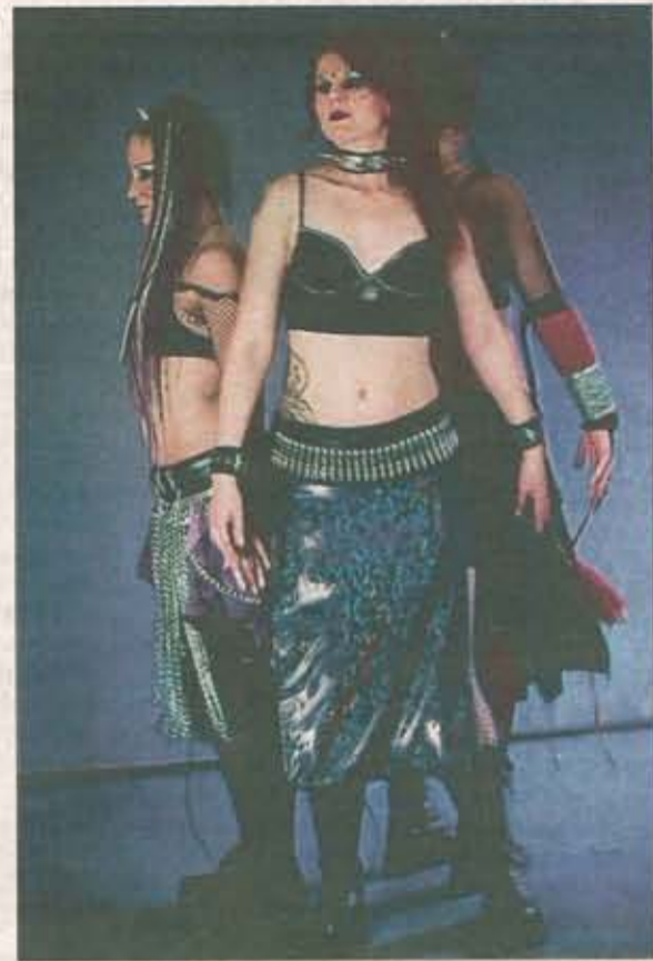
Morganas Döttrar fick mycket positivt gen-svar när de uppträdde på Kulturnatta i maj. I morgon lördag dan-sar de under Umeå Pride.